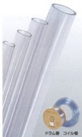
ドラム巻 コイル巻